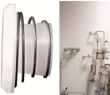
(Bild 1: Wand- und Deckendurchführung »clean-shut«. Bild 2: Anwendungsbeispiel; Quelle: Pharmaserv GmbH & Co. KG)

Juror Dr. Lothar Gail lobt: »Desinfizierbare, robuste, reinraumtaugliche Materialien, Anpassungsfähigkeit an unterschiedliche Wandsysteme, Dichtheit und gute Reinigbarkeit – man muss es als wichtigen Fortschritt werten, dass Pharmaserv offensichtlich aus eigener Anschauung und betrieblicher Sicht eine Lösung entwickelt hat, die in mehrfacher Hinsicht eine Verbesserung darstellt.«